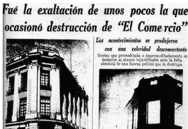
Titular de la quema del edificio de Radio Quito y El Comercio.