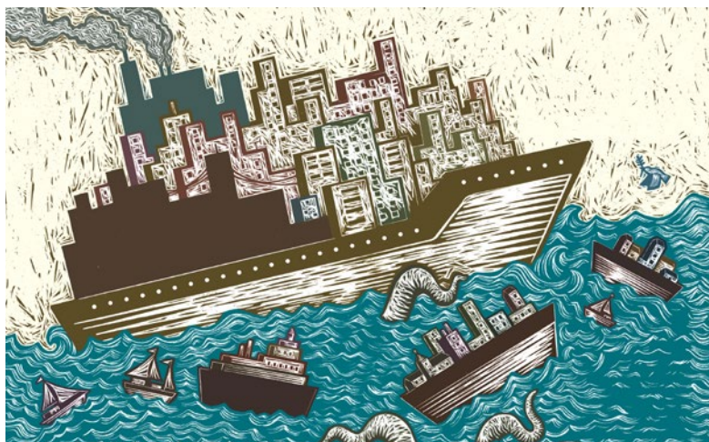
Ilustración: Santiago González