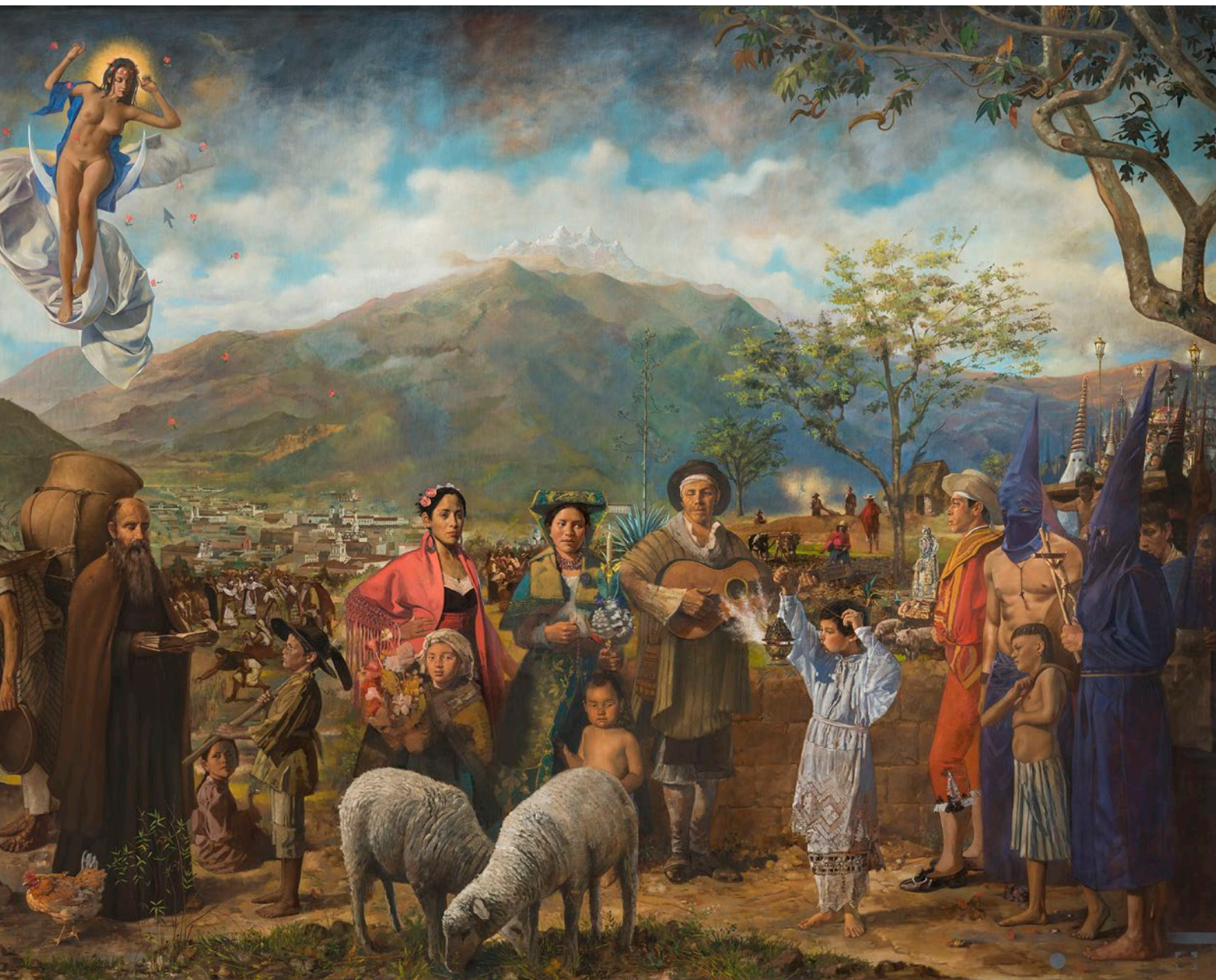
Pintor: Jaime Zapata Montpellier/Quito 2015 Óleo sobre lienzo 8,72 × 3,72 m