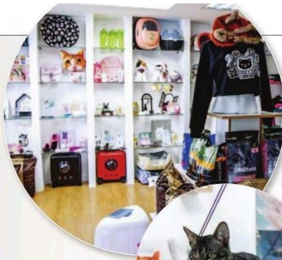
DIFERENTE. Maneki es una cafetería para amantes de los gatos, y ofrece en adopción estas mascotas.