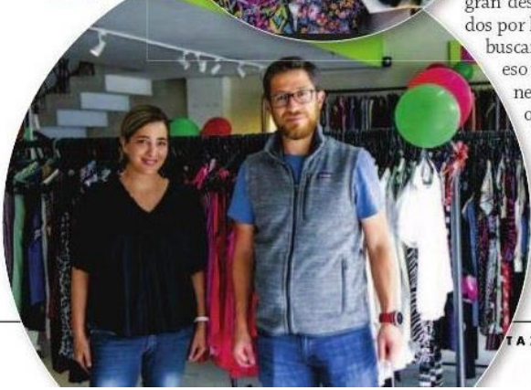
RESILIENTE. Amigui fue afectado por la pandemia, pero fortaleció sus canales digitales. Ahora emplean a 23 personas.

el emprendimiento genera cuatro fuentes de empleo; el volumen de ventas bordea los nueve mil dólares por mes y en 2021 lograron que 456 gatitos encontrarán un hogar.