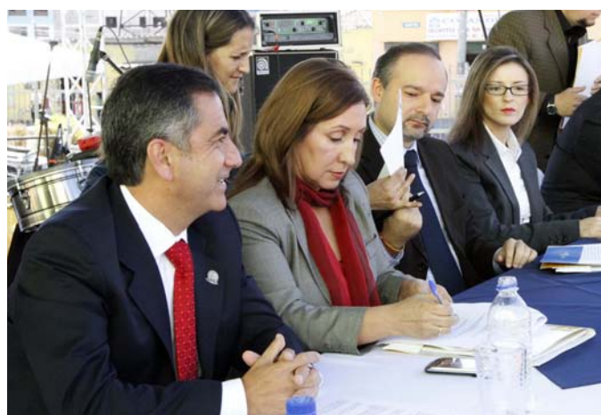
El alcalde de Quito Augusto Barrera, la ministra Doris Soliz Carrión, el ministro Richard Espinosa, entre otros firmaron el convenio.

Los gobiernos autónomos descentralizados se comprometieron en la construcción de centros integrales del Buen Vivir, la implementación de campañas de sensibilización, de sistemas de monitoreo y control para la prevención y erradicación del trabajo infantil, y la promoción y fomento de la economía popular y solidaria en estos espacios.