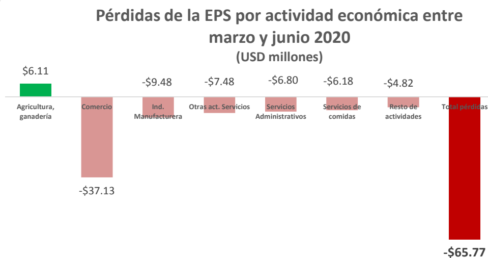
Ilustración 3: Pérdida de la EPS por actividad económica entre marzo - junio 2020

De esta manera las pérdidas de la Economía Popular y Solidaria, a nivel nacional, entre los meses de marzo y junio de 2020 como efecto de la pandemia ascienden a USD -65,77 millones (incluidas ventas netas y exportaciones).