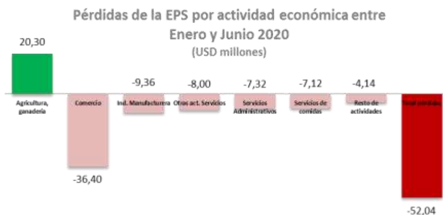
Ilustración 2: Pérdida de la EPS por actividad económica entre enero - junio 2020

De esta manera las pérdidas de la Economía Popular y Solidaria, a nivel nacional, entre el mes de enero y junio de 2020 como efecto de la pandemia ascienden a USD -52,04 millones (incluidas ventas netas y exportaciones).